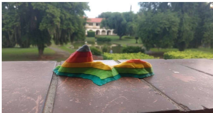
Figura 2. Pão de Açúcar impresso em 3D.

Visando a abordagem da utilização de curvas de nível para o ensino didático optou-se por dividir o objeto impresso em partes (Figura 2). Neste estudo, foi decidida a escolha da divisão em cinco partes, ou níveis, entretanto, é possível dividir em menos ou em mais níveis, o limite de divisão varia de acordo com o tamanho e a espessura desejada da impressão e a relação com os níveis da elevação real do objeto.